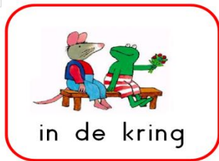
Dagritme kaarten bij kinderdagverblijf Wonderlief

In onze beide stamgroepen (rupsen en vlinders) bieden wij structuur, dit geeft baby's en peuters houvast en herkenning en daarmee het gevoel van veiligheid. Wij werken zoveel mogelijk met dagritme kaarten. Peuters zijn daardoor in staat controle te krijgen over de dagen, het programma en de tijd. Zo weten zij bijvoorbeeld waar zij aan toe zijn en wanneer het moment is dat papa/mama ze weer op komt halen. Voor baby's gelden net even andere eet- en slaapmomenten omdat zij meer rust nodig hebben.