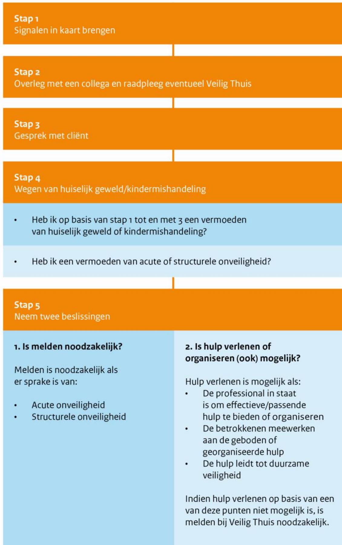
Figuur 1: Stappenplan verbeterde meldcode